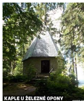
KAPLE U ŽELEZNÉ OPONY