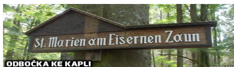
ODBOČKA KE KAPLI

odbočíme doleva po úzké asfaltce do kopce. Na rozcestí je šipka směr Dreissesel/Třístoličník. Obr. 1.