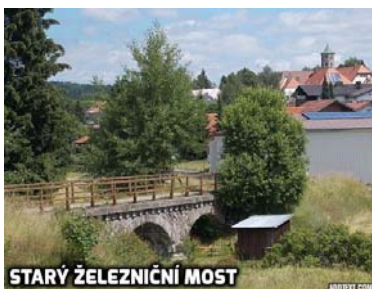
STARÝ ŽELEZNIČNÍ MOST

Od vodního kola se můžete dát buď po již zmíněné cestě (je značena směr Frauenberg) nebo si ještě odskočit k vodopádům. Ony to vlastně ani vodopády nejsou, spíše takové lesní peřejky, ale místo je to hezké. Držte se směrovek, ukazujících k "Wassefalle". Od vodního kola je to pár set metrů lesní pěšinkou. Od vodopádů pak půjdete zpět stejnou cestou na rozcestí u vodního kola a pak po silničce uvedené výše.