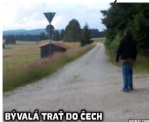
BÝVALÁ TRATĚ DO ČECH

Nu a už nás čeká jen krátká procházka obcí Borské Mlýny (Haidmuhle) po její hlavní silnici. Držte se pořád rovně okolo hotelu Haidmuhler Hof, samoobsluhy Landshutter až k rozcestí u hotelu Strohmayer. Pokračujte okolo něho stále rovně. Po chvíli opouštíte obec a brzy uvidíte Nové Údolí a naše vagony.