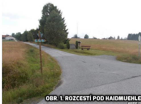
OBR. 1. ROZCESTÍ POD HAIDMUEHLE

Po chvíli se před námi objeví domy obce Borské Mlýny neboli Haidmühle. Až přijdeme na