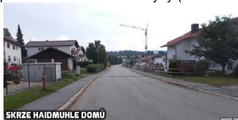
SKRZE HAIDMUHLE DOMŮ