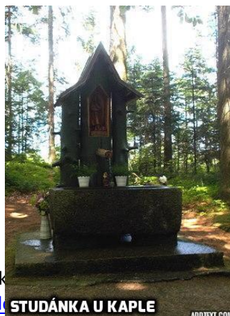
STUDÁNKA U KAPLE